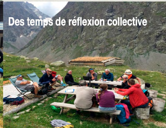
Des temps de réflexion collective