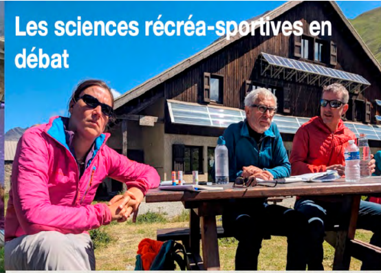
Les sciences récréa-sportives en débat