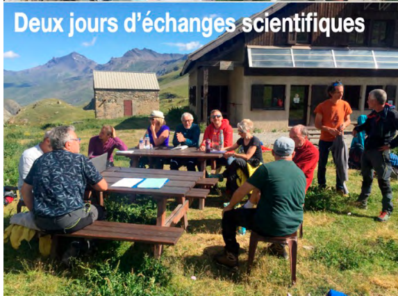
Deux jours d'échanges scientifiques