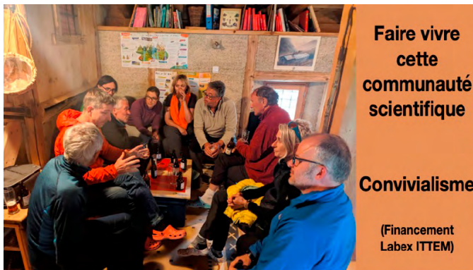
Faire vivre cette communauté scientifique