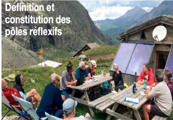
Définition et constitution des pôles réflexifs