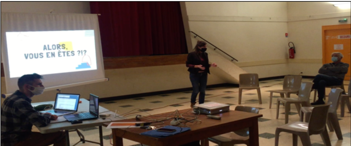
Document 1 : de l'audit récréatif au collectif RECREATER