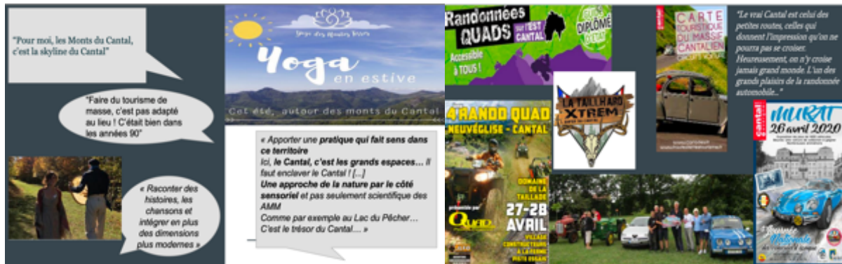
Document 2 : les esthétiques cantaliennes